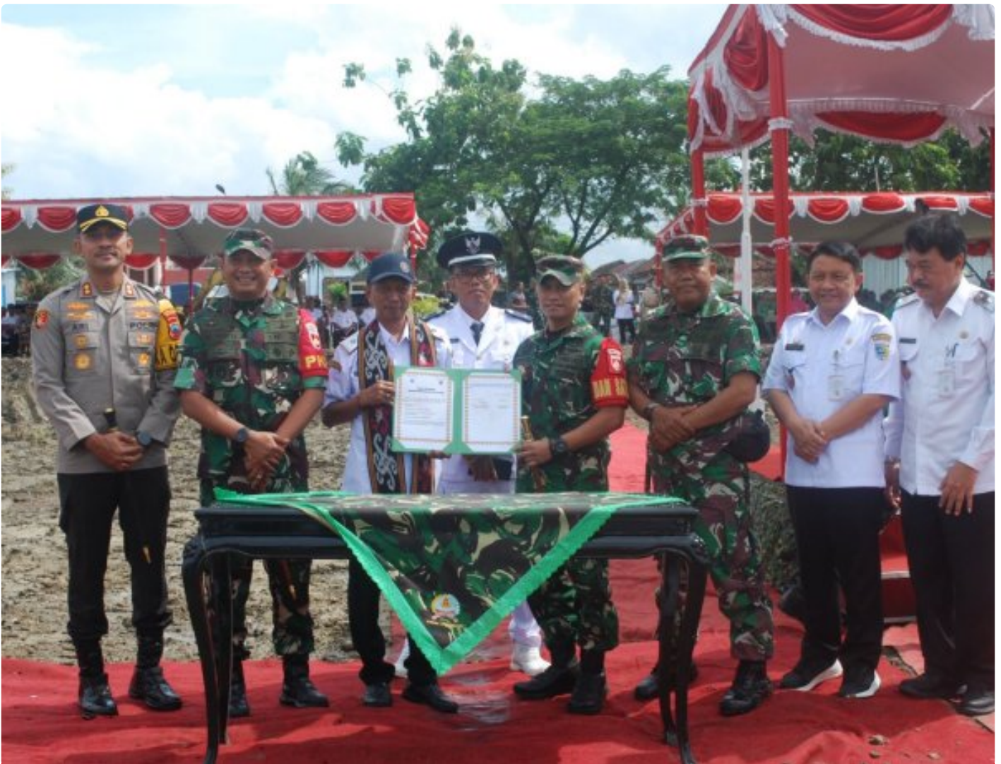
Komando Distrik Militer (Kodim) 0716/Demak menggelar upacara pembukaan TNI Manunggal Membangun Desa (TMMD) Reguler ke-123 Tahun 2025